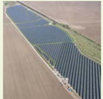
Solarpark Henschleben III 7 MWp