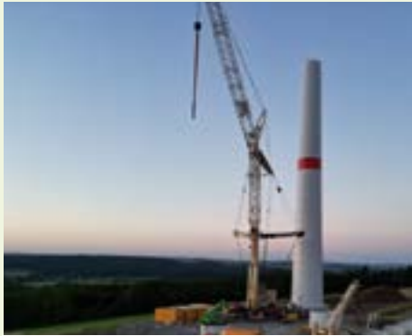
Windpark Niese-Köterberg 13,5 MW