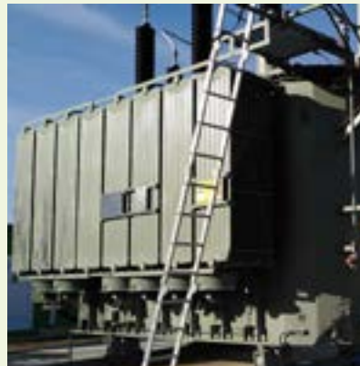
Umspannwerk Briesen 63 MW