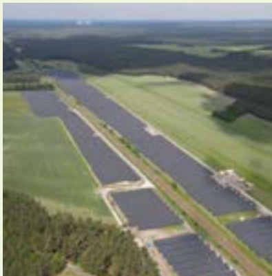
Solarpark Groß-Lubolz 24 MWp