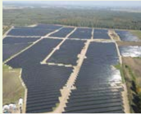
Solarpark Petershagen 70 MWp